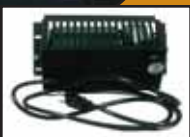
Ventilateur / Blower