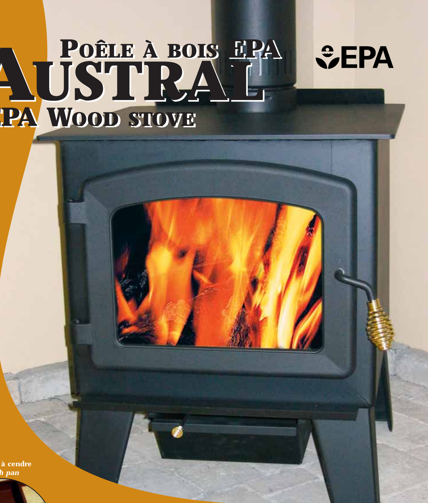
Tiroir à cendre Ash pan