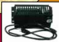
Ventilateur / Blower

Grande chambre à combustion / Large firebox