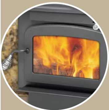
Heavy-duty cast iron door Porte en fonte massive