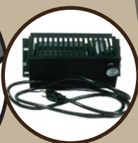
Blower / Ventilateur