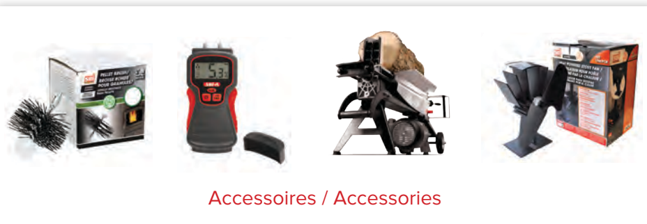
Accessoires / Accessories

Visit Drolet.ca and discover our wide range of professional accessories and maintenance products designed especially to help you get maximum satisfaction from your wood or pellet heating appliance.