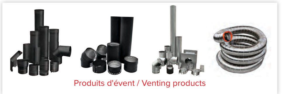
Produits d'évent / Venting products